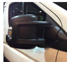
↑ стандартні зовнішні дзеркала.